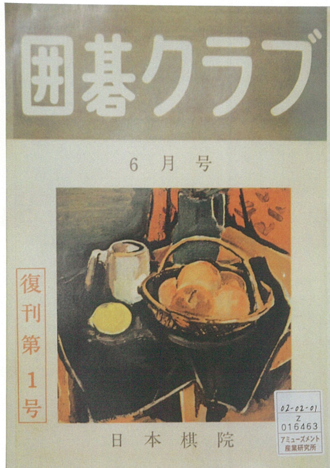
第二次世界大戦後復刊した『囲碁クラブ』 昭和29年6月1日発行（第1巻第1号）（ID:16463）