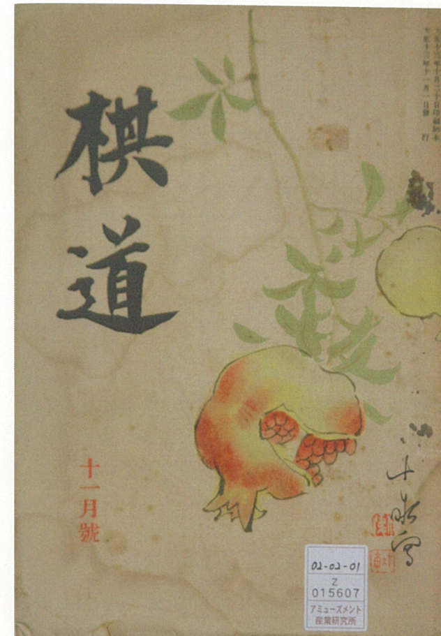
創刊間もないころの『棋道』 大正13年11月1日発行（第1巻第2号）（ID:15607）