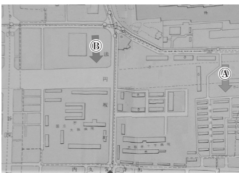
図3 上町1丁目と法円坂公団アパート付近。

昭和35年（1960）の『京阪神便覧 大阪市区分地図帳』（昭文社）より作成。右端が法円坂公団アパート、中央下が上本町1丁目交差点。中央大通りは、上町筋西側まで立ち退きで拡幅されているが、東側はまだ立ち退いていない。