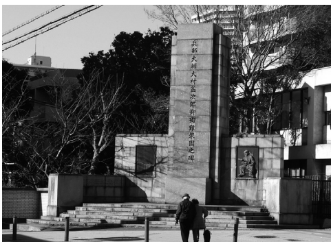
図2-2 兵部大輔大村益次郎卿殉難報國之碑