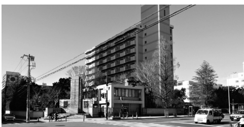
図2-1 上町の交差点。東南から西北をのぞむ。軽トラックが停車しているのが上町筋で、向こう側の角にあるのが大村益次郎の碑。右が現在のバス停。