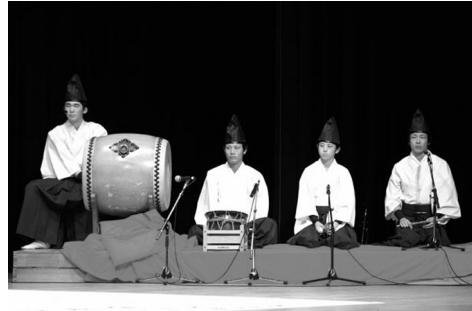
写真2 楽人の写真 （吉田神楽団 HP より転載）

芸北神楽は演劇的要素が色濃く、多くの観客を集める文化的活動として注目され、近年では関東方面での公演活動も毎年行われるようになってきている。詳細は拙稿（『フロー理論の展開』第8章）においてもまとめているが、神楽の技量を競う「競演大会」が神楽人気を後押ししてきた存在であるといえる。この競演大会では「新舞」「旧舞」というカテゴリーが設けられ十数団体が技を競い合う。会場は早ければ数日前から良い席を確保するために観客が場所取りのための用意を行う。そのため当日の会場は朝早くから長蛇の列となることが多い。広島の神楽について調査研究を行っている NPO 法人「ひろしま神楽芸術研究所」の作成したパンフレット（2007年当時）には、「広島神楽の年間の鑑賞者は、広島東洋カープの球場に集まるファンの数を超えている」といった内容を示す一文がある。また広島県内には200を超える神楽団があることや、秋祭りの神楽の奉納以外にも年間を通して神楽の公演が行われていることなどを考えれば、この NPO 法人が作成したパンフレット（作成当時）は現実的な内容を表す文面を含むといっても差し支えないのかもしれない。