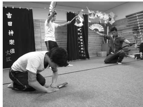
写真4 練舞場での練習

今回、調査対象となった神楽団の活動状況を説明する。午後8時過ぎから神楽団員が練舞場と呼ばれる練習場所に集合し始める。その後、練習が可能となる人数が集まるまで衣装の整理、過去に行われた上演についての振り返り、今後の神楽団の打ち合わせが行われていく。その後、近日中に上演予定の演目を中心とした練習が行われる（写真4）。この際、大太鼓、小太鼓、手打鉦、笛の囃子も奏でられる。練習の途中に囃子、舞などで微調整が必要な場面や間違い等があった場合は、練習が中断され、その部分について修正が加えられ、引き続いて演目が終わるまで練習が行われる。練習は年間を通して水曜日と金曜日の週に2回、午後10時半前後まで実施される。また上演の当日も最終確認のための練習をすることもあるという。