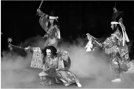
写真1 舞手の写真

泰臣によれば、広島県の神楽は「芸北神楽」「安芸十二神祇」「芸予諸島の神楽」「比婆荒神神楽」「備後神楽」、これらの5つに分類できるという。本研究で対象としている芸北神楽は主に複数の舞手（写真1）、囃子（大太鼓、小太鼓、手打鉦、笛）（写真2）を担当する4人の楽人によって構成されている。