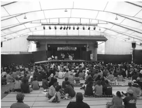
写真3 神楽門前湯治村の神楽ドーム

団が集まっている地域である。特に安芸高田市美土里町には3000人収容の神楽鑑賞のドーム（写真3）や神楽資料館、温泉、宿泊施設も併設した、神楽のテーマパークともいべき施設、神楽門前湯治村が平成10年に作られた。ここでは安芸高田市で活動している22の神楽団が年間、毎週末（金曜日、土曜日、日曜日）に神楽の定期公演を行っている（年間約150日）。平成16年3月1日の合併実施により、高田郡吉田町、同郡八千代町、同郡美土里町、同郡高宮町、同郡甲田町及び同郡向原町の名称は、「安芸高田市」に変更になった。もともとは旧美土里町の13の神楽団が神楽門前湯治村で定期公演を行ってきたが、平成の大合併により、新しく安芸高田市として新設合併した後は、安芸高田市内全域の神楽団が神楽門前湯治村の定期公演に参加するようになった。